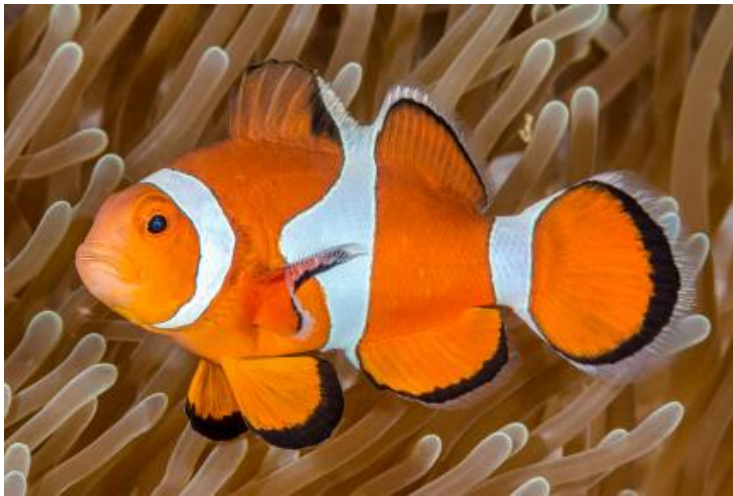
Figure 1 - Poisson-clown à trois bandes Amphiprion ocellaris

C'est une tradition : le 1 er avril, Planet-Vie propose une information sérieuse sur les poissons. Cette année, découvrez comment les poissons-clowns échappent aux piqûres des anémones de mer grâce, vraisemblablement, à la composition particulière de leur mucus.