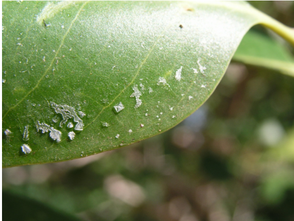
Figure 3 - Cristaux de sel sur une feuille de Avicennia officinalis , une espèce de palétuvier d'Asie

Par ailleurs, l'observation des feuilles de certaines espèces de palétuviers révèle la présence de cristaux de sel à leur surface (Figure 3). Ces cristaux résultent de l'excrétion du sel par l'arbre via des glandes présentes au niveau de ses feuilles [9a][10]. C'est un des multiples mécanismes qui permettent aux palétuviers de vivre malgré la richesse en sel du milieu, toxique pour la plupart des végétaux en raison du stress osmotique qu'il induit au niveau des cellules [11].