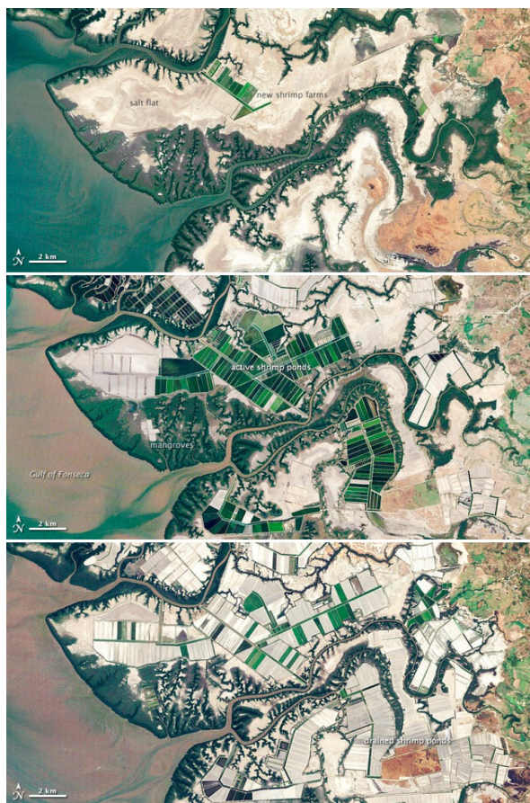
Figure 8 - Évolution du paysage dans le golfe de Fonseca, le long de la côte pacifique du Honduras et du Nicaragua (1986, 1999, 2011)

Sur ces images satellites, les mangroves apparaissent en vert foncé et bordées de brun. Ces images montrent un développement très rapide de l'aquaculture, qui s'accompagne d'une dégradation progressive des écosystèmes naturels et d'une pression croissante sur les mangroves. La différence de couleur des eaux du Golfe est probablement due aux marées : les images ont été acquises à marée basse en 1999 et 2011, et à marée plus haute en 1986.