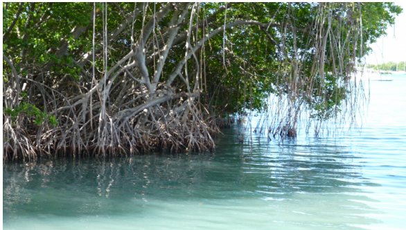
Figure 1 - Racines-échasses de palétuviers, ancrées dans des sédiments en eau calme, Bahia de Rincon, Porto Rico

Les mangroves sont des écosystèmes forestiers présents dans les régions tropicales, subtropicales et tempérées chaudes du monde. Elles se développent dans les zones côtières, dès lors que l'eau est calme et qu'il y a suffisamment de sédiments pour y ancrer des racines [1a] (Figure 1).