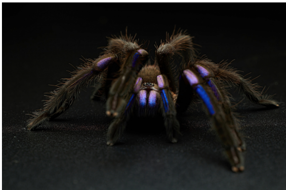
Figure 6 - Chilobrachys natanicharum , une espèce de tarentule de Thaïlande, découverte en 2023

Souvent difficiles d'accès, les mangroves sont également l'habitat d'espèces méconnues, dont de nouvelles sont encore découvertes aujourd'hui. Parmi les plus récentes et les plus remarquables, une nouvelle espèce de tarentule, Chilobrachys natanicharum , endémique de Thaïlande, a été décrite en septembre 2023 (Figure 6) [15a]. Son habitat s'étend sur certaines mangroves ainsi que sur certaines forêts à l'intérieur des terres de la Thaïlande.