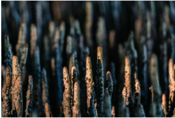
Figure 5 - L'observation des pneumatophores montre la présence de lenticelles où se produisent les échanges gazeux

Auteur(s)/Autrice(s) : Bradley Huchteman