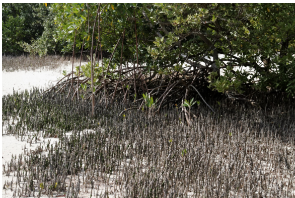
Figure 4 - Photographie d'un palétuvier avec des pneumatophores, Floride, États-Unis

Par exemple, chez les espèces des genres Avicennia et Sonneratia , des racines aériennes appelées pneumatophores émergent verticalement des racines souterraines horizontales (Figure 4). Grâce à des pores appelés lenticelles qui en couvrent la surface (Figure 5) et où se produisent les échanges de dioxygène [9b][12], les pneumatophores agissent comme des organes respiratoires. Les « racines-échasses » de certaines espèces (Figure 1), présentent également des lenticelles et sont un autre exemple d'adaptation à l'anoxie des sols et à l'engorgement cyclique par les marées.