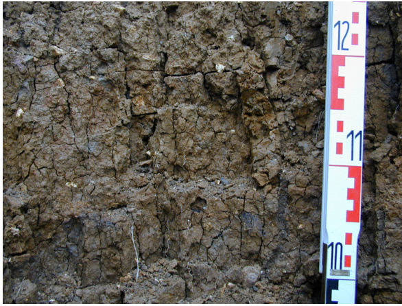
Figure 2 - Structure prismatique se subdivisant en agrégats polyédriques anguleux observée dans un horizon argileux profond