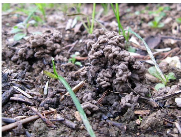
Figure 3 - Turricule de lombric à la surface d'un sol cultivé

Ces turricules peuvent être observés aussi sous agriculture lorsque les pratiques permettent le maintien d'une population importante de lombrics (Figure 3).