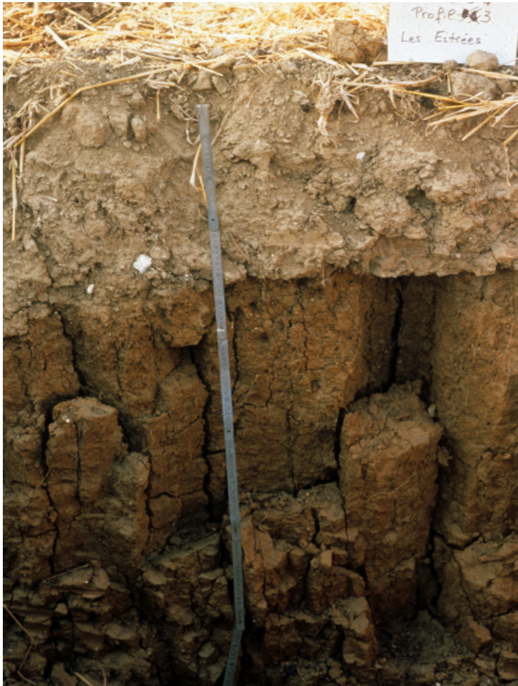
Figure 1 - Horizons semi-profonds argileux à structure prismatique grossière sous un horizon labouré limoneux Région de Mantes (Yvelines)