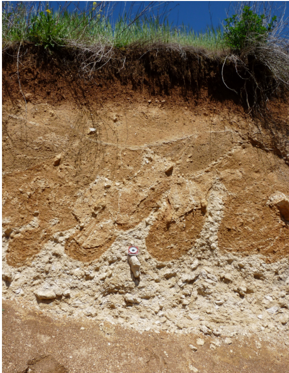
Figure 7 - Cryoturbation remaniant un calcaire tendre