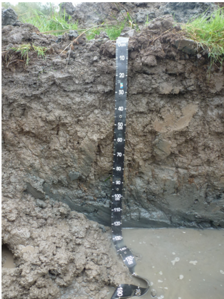
Figure 6 - Réductisol formé dans des alluvions de la Loire

Réductisol formé dans des alluvions de la Loire. Pour observer ce type de sol dans une fosse, il faut pomper l'eau de la nappe qui a tendance à revenir assez vite.