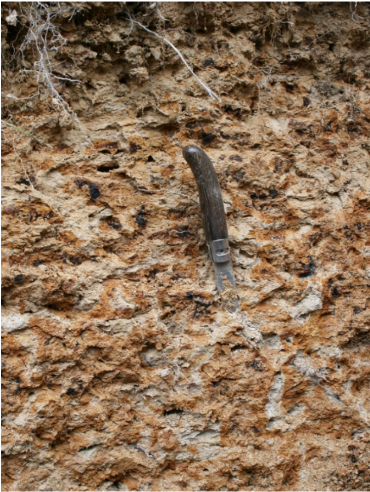
Figure 5 - Les traits hydromorphes rédoxiques

Les traits rédoxiques s'expriment par l'association de trois couleurs : gris clair (volumes appauvris en fer et/ou fer réduit), rouille (fer oxydé) et noir (oxydes de manganèse).