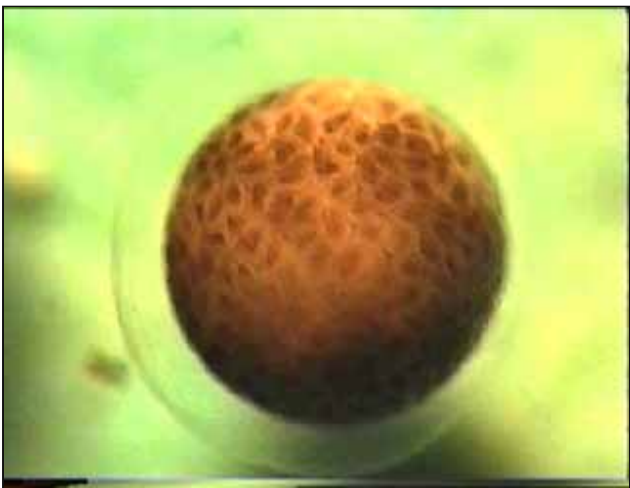
Stade 256 cellules.