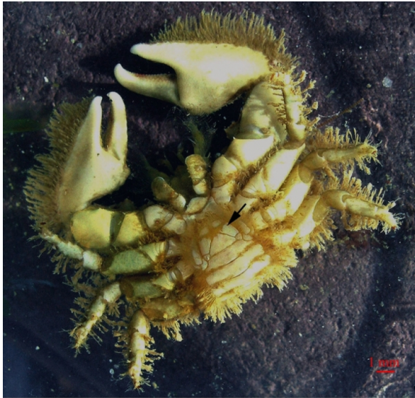
Figure 2 - Un porcellane en vue ventrale

Auteur(s)/Autrice(s) : Guy Echalié Licence : Pas de licence spécifique (droits par défaut)