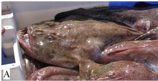
Figure 1 - Baudroie entière et son squelette

La baudroie commune ( Lophius piscatorius ) est un poisson osseux largement trouvé sur nos côtes. Sa peau est nue (pas d'écaille). De grande taille (elle peut mesurer plus d'un mètre) elle est peu active et vit le plus souvent sur les fonds marins, en grande partie recouverte de sable ou de vase.