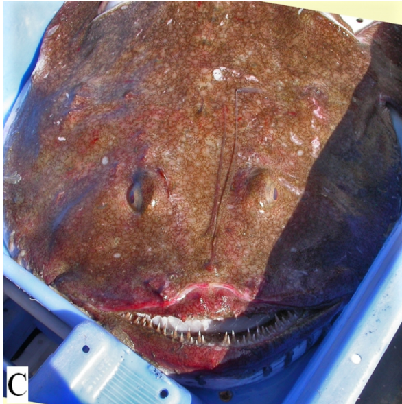
Figure 2 - Tête de boudroie montrant le filament