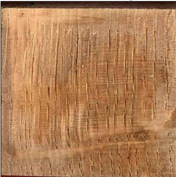
Figure 5 : Section radiale de bois de chêne

Cliquer sur l'image pour une version agrandie.