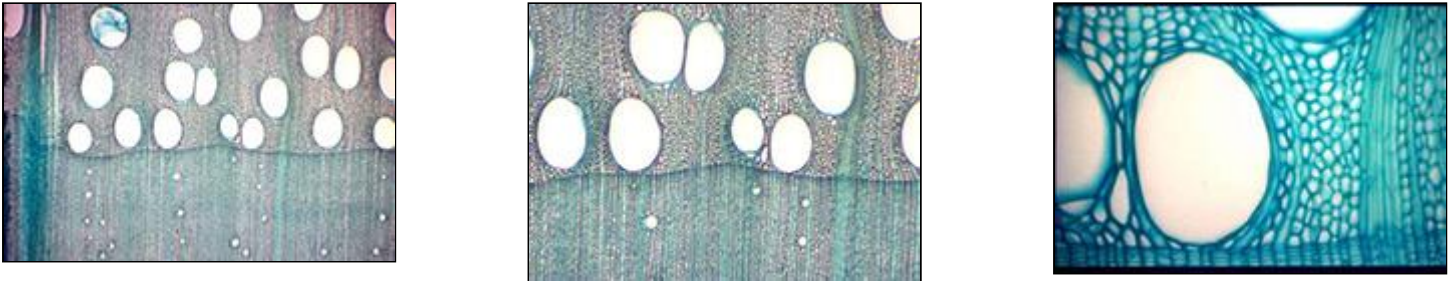
Figure 7 : Trois sections transversales à 3 grossissements différents

Cliquer sur les images pour une version agrandie.