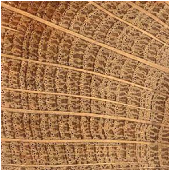
Figure 3 : Détails d'une coupe transversale de bois de chêne