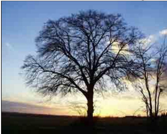
Figure 1 : Port d'un chêne

Le texte est extrêmement bref. Il présente seulement des illustrations sous forme d'icônes de petite taille. En cliquant sur ces icônes, vous accéderez à des images plus grandes.